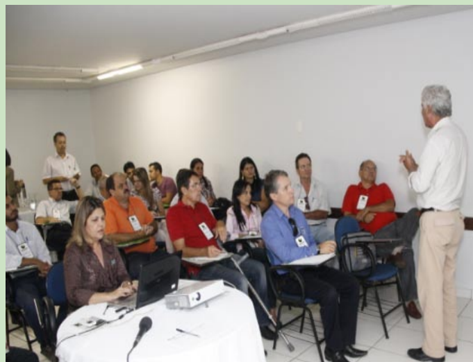
Consultores conhecem a proposta da ADENOR

“Com o funcionamento da Rede de Consultores, a ADENOR estará apta para elaborar projetos, através de Rede de Consultores. Também ser consultora, como correspondente, de várias instituições de fomento - privadas, públicas, ong's, internacionais - e encaminhar propostas e projetos de todos os segmentos, tanto na área pública como privada. As propostas seriam elaboradas pelos consultores cadastrados na Rede, interagindo todas as ações de desenvolvimento da região”, explica.