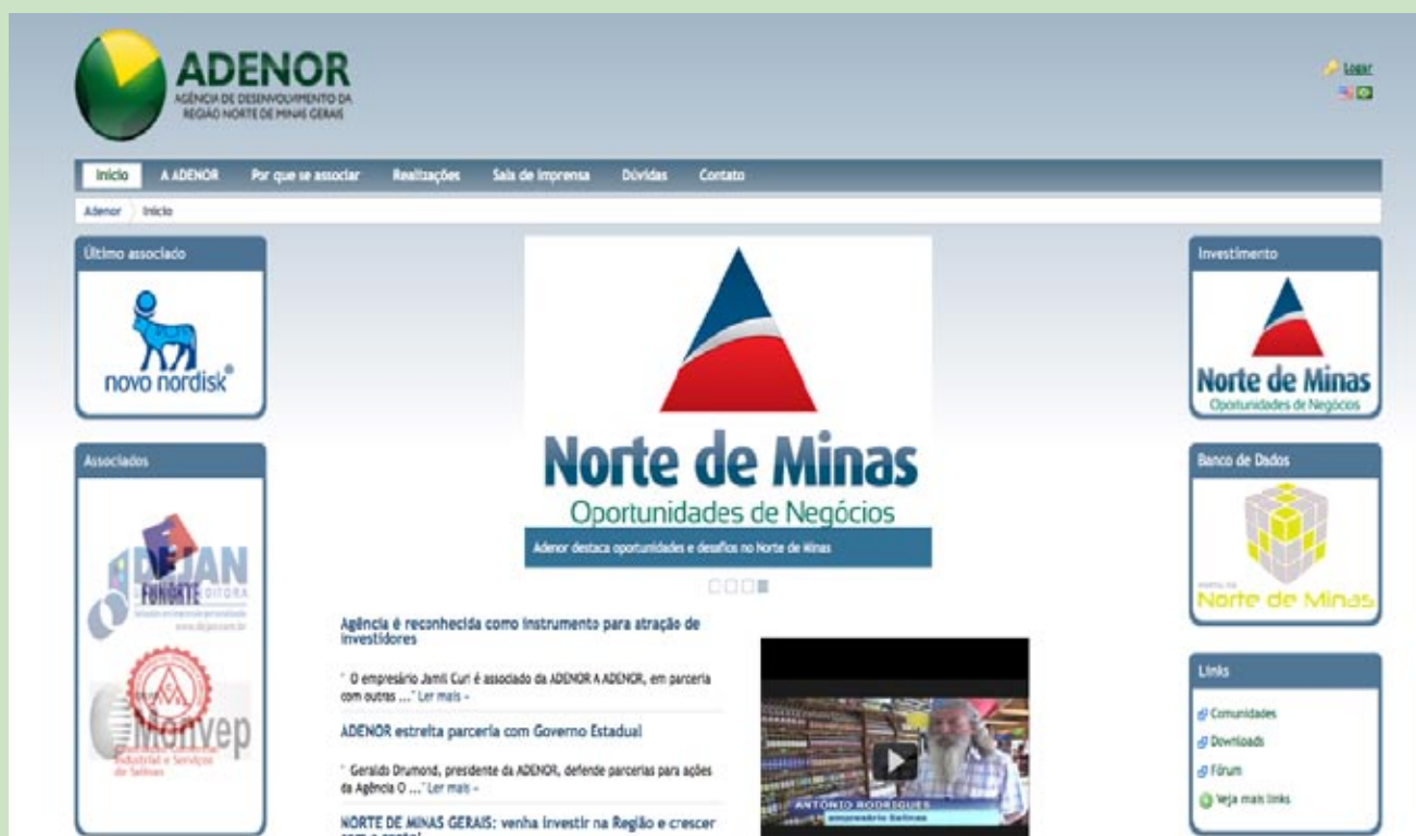
Página Inicial site ADENOR

A Agência vai explorar este canal de comunicação na interação com potenciais investidores de todo o mundo. Com novo visual, o site www.adenormg.com.br foi reescrito para torná-lo uma útil e estratégica ferramenta de divulgação das oportunidades de negócios e potencialidades da região.