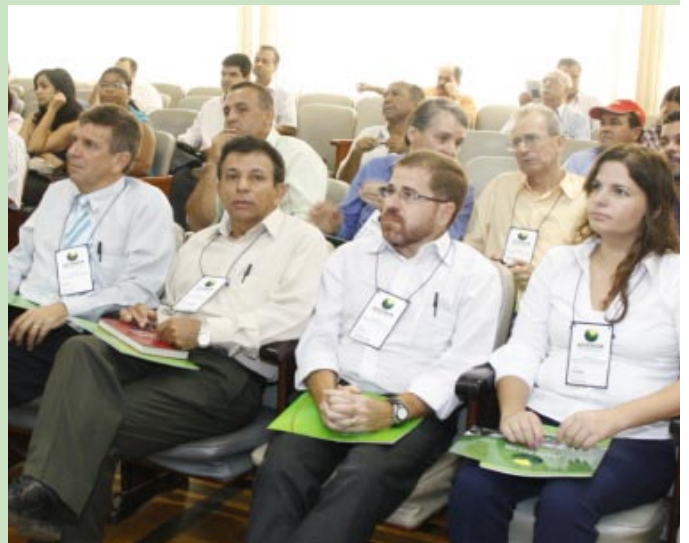
Entidades, empresários, consultores e conselheiros participaram do evento.

O evento contou com a participação dos conselheiros, prefeitos, empresários, consultores e representantes de entidades como Sebrae, Emater, ACI, Fiemg, BNB e INDI. Foram discutidos temas como a política territorial do Banco do Nordeste; a atuação do Sebrae no NM; Projetos de Recuperação das Bacias Hidrográficas, pela Fiemg e o papel do Instituto de Desenvolvimento Integrado de Minas Gerais – INDI.